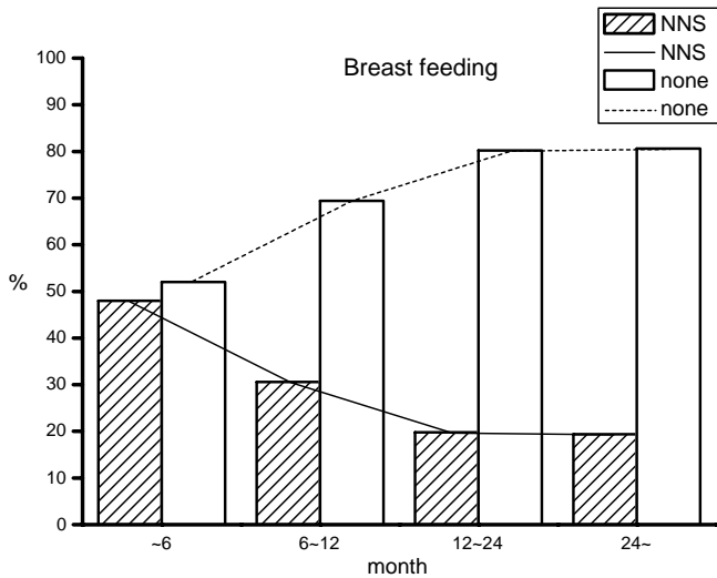
Fig. 1. Correlation of breast feeding duration and non-nutritive sucking. The longer breast feeding, the less non-nutritive sucking (Linear by linear test, p = 0.000 ).