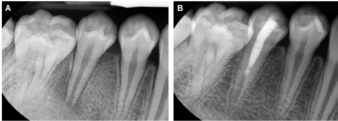
Fig 2. (A) Immature root apex with a necrotic infected root canal with apical periodontitis. The canal was irrigated with 1.52% NaOCl and tri-antibiotic paste. After 3 weeks, the antibiotics was removed and the blood clot was brought in the canal and the canal was filled with MTA (B) At 15 months, the patient is asymptomatic and apical healing is obvious with remarkable lengthening of the root.

피하려는 것이다(Fig. 2). 이를 근거로 기존의 근침형성술 또는 apical barrier를 사용하는 것과 다르게 괴사된 미성숙 영구치의 재생근관치료를 할 때에는 지속적인 치근의 발달, 상아질벽 두께의 증가 및 개방된 치근침의 폐쇄를 예견, 기대할 수 있다 9) .