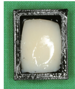
Fig. 1. Teeth embedded in the mold with acrylic resin.

총 135개의 치아를 표면에 있는 치석 및 유기물질을 스케일러로 제거한 후, 불소가 포함되지 않은 퍼미스를 이용하여 세척하고 고속 절삭 다이아몬드 디스크를 이용하여 치근을 절단하였다. 치아의 고정을 위하여 3D 프린터로 제작한 가로 23.0 mm, 세로 17.0 mm, 높이 12.0 mm를 가진 두께 2.0 mm의 poly lactic acid 주형을 제작하였다(Fig. 1). 치아는 아크릴릭 레진을 이용하여 순측 치관이 보이도록 주형에 매몰하였고, 레진 경화 시 발생하는 열을 분산시키기 위하여 차가운 증류수에 30분 동안 보관하였다. 순측 법랑질 표면과 블록 하단을 평행하게 하기 위하여 300, 600, 1200 grit 실리콘 카바이드 연마지를 이용하여 순차적으로 연마하였다.