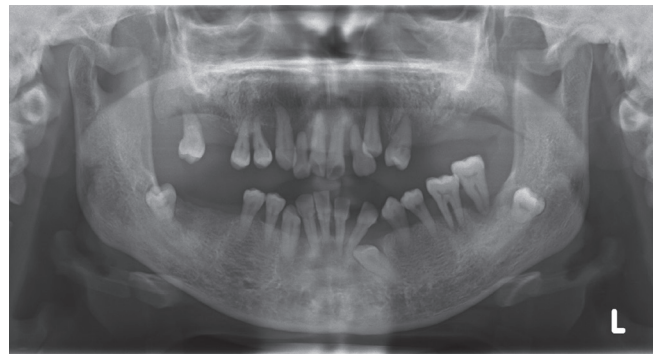
Fig. 3. Panoramic radiograph of the proband's mother.