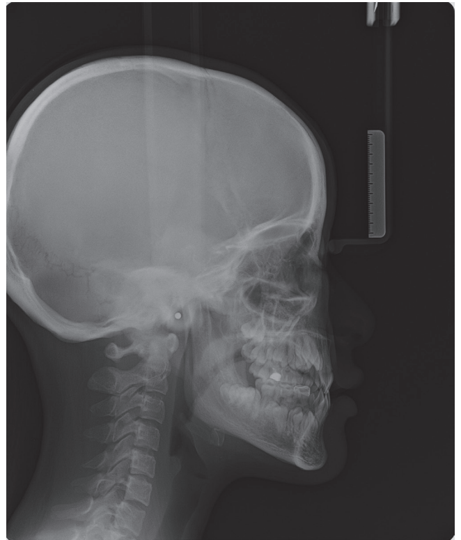
Fig. 2. Lateral cephalogram of the proband.

RUNX2 유전자의 염기 서열 분석 결과, 대상자 모두에서 이전에 보고되지 않은 새로운 변이를 확인하였다. 3번 exon 내의 357번 염기서열인 시토신(cytosine)이 제거된 변이가 확인되었고(NM_001024630.4: c.357delC), 이는 2개의 대립유전자(allele) 중 한 쪽에서만 발견된 이형접합(heterozygous)으로 나타났다 (Fig. 4). 발견된 돌연변이로 인해 해당 영역에서 번역되는 아미노산이 아스파라진(asparagine)에서 트레오닌(threonine)으로 치환되고, 이후의 염기서열의 -1 net frameshift로 인해 돌연변이 위치에서부터 24번째 아미노산이 종결코돈으로 치환된다 [p.(Asn120Thrfs*24)].