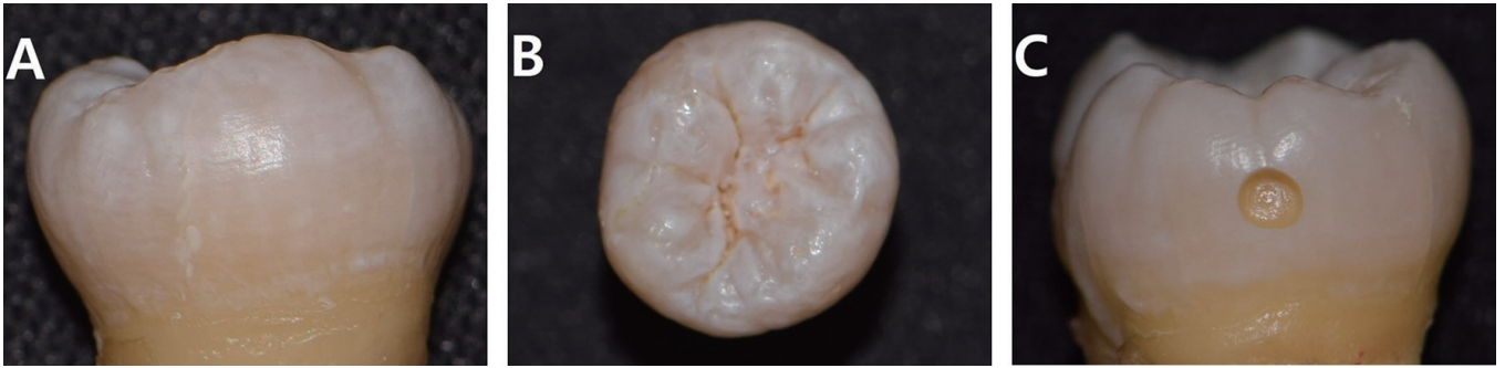
Fig. 1. (A), (B) Artificial white spot was formed on the surface of the enamel. (C) Round shaped cavity was made on a proximal surface.

를 이용하여 충분한 주수 하에 근원심면 중앙부에 각각 지름 2.0 mm, 깊이 1.5 mm 크기의 원통형 와동을 형성하였다(Fig. 1C). 각 치아 별로 형성한 와동을 무작위로 실험군과 대조군으로 나누었다. 실험군에는 와동 주변의 탈회된 치면에 infiltrant resin (Icon®, DMG, Hamburg, Germany)을 적용하였고, 대조군에는 적용하지 않았다. Infiltrant resin의 적용은 다음과 같이 이루어졌다. 치아 표면에 15% 염산겔인 Icon Etch를 2분간 적용 후 30초간 수세 및 건조하였다. 다음으로 탈수제재인 Icon dry를 30초 적용하고 건조하였다. 저점도 레진인 Icon infiltrant를 3분간 적용 후 40초 광중합하였고 1분간 재적용 후 40초 광중합하였다. 광중합기로는 multiwavelength LED인 Valo® LED Curing Light (Ultradent Products, South Jordan, UT, USA)를 사용하였으며 1000 mW/cm 2 단일 광도로 광중합을 시행하였다.