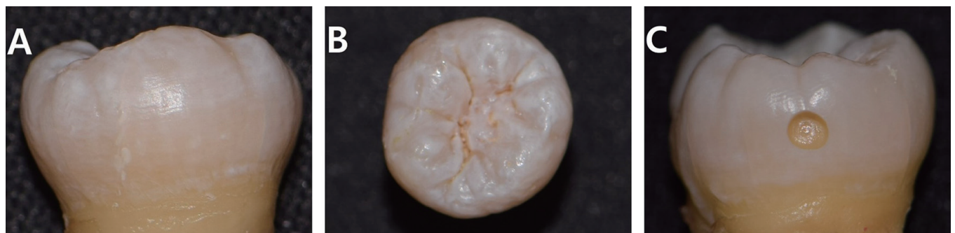
Fig. 3. μ-CT images with microleakage. (A) No leakage, Score=0, (B) Leakage depth up to two third of the internal surface, Score=2, (C) Leakage through the entire lateral surface to the bottom of the restoration, Score=3.

이 연구에서는 최소 침습 치의학 관점에 입각하여, 와동성 초기 우식 병소의 수복 시 레진 침투법을 활용해 치질 삭제를 최소