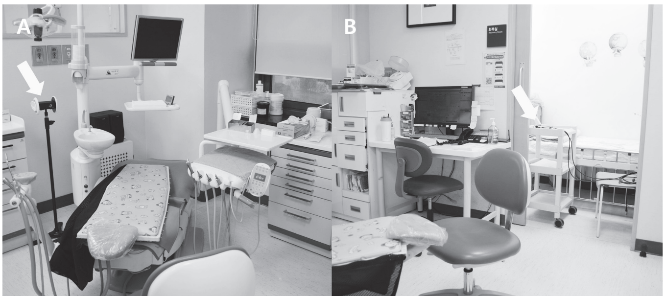
Fig. 2. Room where the recording took place. (A) View from recording assistant, (B) View from pediatric dentist.

술자의 귀와 환자의 구강의 거리를 측정하였을 때 40 cm으로, 120 cm 거리에서 녹음된 정보를 40 cm 거리의 값으로 변환하기 위해 동일 실험장소에서 치과의사의 귀 위치(40 cm) 및 녹음기 위치(120 cm)에 각각 소음계를 고정하고 환자의 구강 위치에