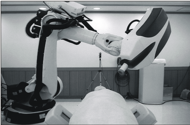
Fig. 2. Photograph of Cyberknife Radiosurgery System, consisting of a linear accelerator mounted on a six-axis robotic manipulator that permits a wide range of beam orientations.

부학적 구조물에 대한 영상을 실시간으로 얻을 수 있다. 이를 통해 감지된 두개골경계표(cranial bony landmarks)가 치료 전 환자의 치료 계획용 컴퓨터 단층촬영 이미지(CT images)를 통해 얻어진 두개골경계표에 서로 비교되어, 실제표적 위치와 현재표적 위치와의 차이를 확인하게 된다(Fig. 3). 이와 같은 real-time control loop를 통해 실제표적의 정확한 위치가 로봇 조정기에 인식되면, 로봇 조정기는 실제표적에 계획된 선량을 조사하게 된다. 또한 치료 중 환자 자세 변화로 실제표적의 위치가 변하게 되면, 반복적으로 실시간 영상이미지가 얻어지고 다시 real-time control loop에 의해 실제표적으로 방사선 조사방