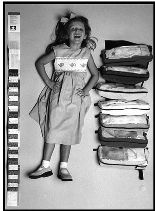
Fig. 1. The Broselow tape and spaces are labeled with the estimated weight corresponding to the measured length. Reproduced from https://commons.wikimedia.org/wiki/File:BTape3.jpg [cited 2016 May 10].

키를 기반으로 소아의 체중을 추정하려는 시도는 1980년부터 있었고 16,17) , 1986년에 James Broselow가 단순화된 키를 기반으로 하는 체중 추정 방법을 개발하였다. 1979년에 미국 National Center for Health Statistics에서 1963년부터 1975년까지 미국 18세 이하 소아 20,000여 명의 표준 샘플을 통해 백분위가 나오는 신체측측 곡선을 발표하였다. Broselow가 이 곡선에 근거를 둔 키와 체중의 50백분위수를 이용하여 현재의 Broselow tape을 개발하였다. 이 테이프에는 해당 키 구간의 추정 체중이 표시되어 있으며 체중과 함께 약물 용량 및 기구 크기가 표시되어 있어, 소생술을 담당하는 의료진이 계산할 필요없이 약물 용량 및 기구 크기를 선택할 수 있는 방법이다. Broselow tape의 유용성에 관해 다양한 연구가 시행되